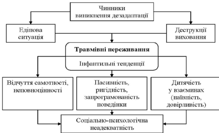
Рис. 5. Схема «Чинники виникнення дезадаптації суб'єкта»

Таким чином, на основі аналізу емпіричного матеріалу та теоретичних джерел представлено схему впливу травмівних переживань дитинства на дезадаптацію суб'єкта (рис. 5).