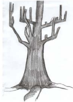
Рис. 2. «Я в сім'ї батьків»

На рис. 2 зображено засохле дерево та осінь, що символізує образу автора на батька. Протагоніст стверджує, що боялася його покарань до смерті та ладна була вмрети, аби не залишатися з батьком наодинці.