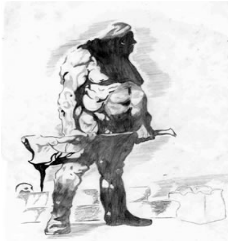
Рис 4. «Я серед людей»

Автор малюнку зобразила себе у образі воїна-одинака який готовий до бою. Автор стверджує, що таку готовність він відчував усе життя і будь-яку агресію з боку оточення він мужньо долав, хоча й залишався самотнім. Психологічний аналіз малюнка дозволив стверджувати, що протагоніст з дитинства був жертвою нападів батька. За словами автора, батько виступав катом щодо нього, що виявлялося в підвищеному контролі його дій, поглядів на життя. Автор зазначає, що усіма своїми соціальними досягненнями він зобов'язаний батькові, який навчив його «прозі» життя, створивши пекельне дитинство. Дитинство, за словами автора, навчило його виживати в агресивному світі. Завантаженість базальною тривогою заважає автору бачити індивідуальність оточуючих його людей у зв'язку з очікуванням небезпеки, а недовіра до доброти інших людей породжує тривожність, готовність до агресивності.