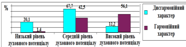
Рис. 2. Рівень духовного потенціалу у вибірках з дисгармонійним та гармонійним характером (у %)

Для перевірки гіпотези щодо впливу духовних детермінант на гармонійність характеру юнацтва було проведено дослідження за допомогою методу полярних груп . У загальній вибірці були виділені підгрупи з гармонійним і дисгармонійним характером, серед яких визначено відсотковий розподіл осіб з різним рівнем духовного потенціалу (рис. 2). Виявилось, що у вибірці з дисгармонійним характером переважає відсоток представників низького (20,1%) та середнього (67,7%) рівня духовного потенціалу, а у вибірці з гармонійним характером значно превалюють особи з високим рівнем духовного потенціалу (56,1%).