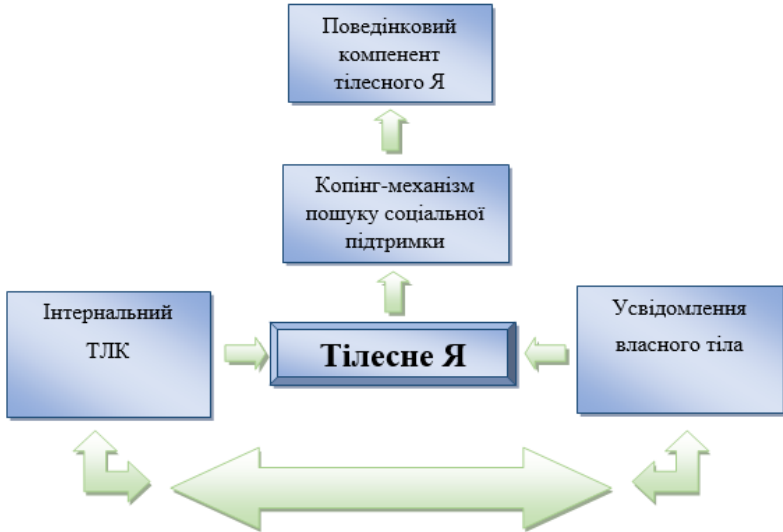
Рис.2. Модель подолання несприятливих обставин на рівні взаємодії з тілесним Я.

Висновки з даного дослідження і перспективи подальших розвідок у даному напрямку. Результатом проведеного дослідження стало з'ясування того факту, що тілесний локус контролю безпосередньо пов'язаний з усвідомленням власного тіла. Інтернальний локус контролю свідчить про максимальний контакт з тілесним Я на рівні внутрішнього діалогу.