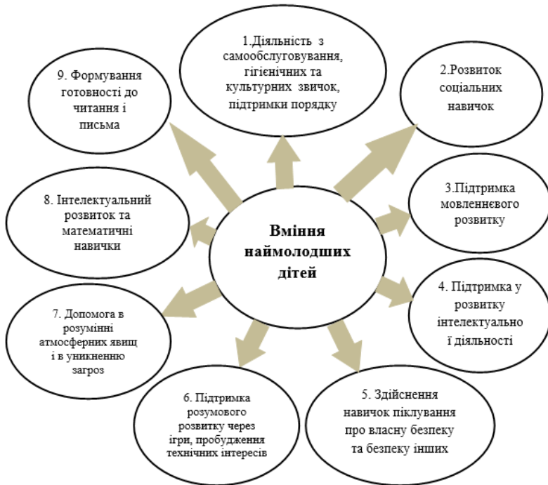
Рис.2. Сфери вмінь наймолодших дітей.

Найважливіші роки навчання починаються з народження. Мозок зазнає величезних змін, коли дитина розвивається і вчиться жити в навколишньому життєвому середовищі. У ці ранні роки мозок дитини зростає найшвидше, і здатний поглинати більше інформації, ніж у більш пізні періоди життя. Сфери розвитку, які охоплює дошкільна освіта, включають особистісний, соціальний та емоційний розвиток, спілкування: розмова та слухання, світові знання, творчий та естетичний розвиток, математичне усвідомлення, фізичне здоров'я та розвиток, ігри, командна робота, навички самопомоги, соціальні навички, наукове мислення, грамотність. Діти навчаються пісням, танцям, драмі, співам, іграм, малюванню, виготовленню плакатів.