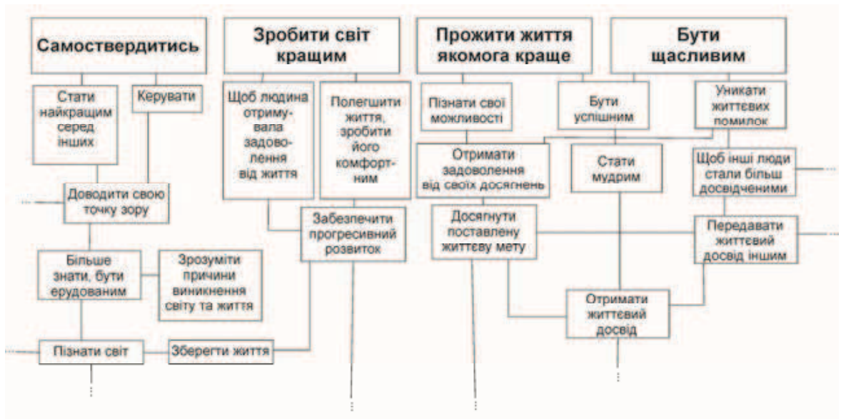
Рис. 2. Фрагмент структури світогляду О. Т., 19 років (вибірка юнаків)