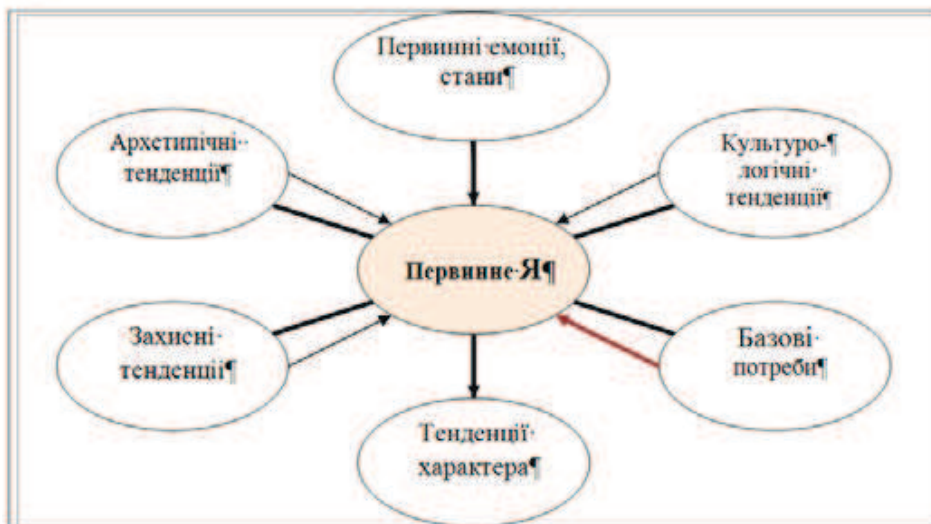
Рис. 1. Первинне Я в структурі природної Базової особистості

Виклад основного матеріалу дослідження. Автор прийшов до висновку, що Я складається з трьох центрів відповідно до трьох основних рівнів особистості [7]. Останні відрізняються за критеріями генотип-середовищної обумовленості компонентів і за ступенем їх сталості, стійкості: 1 – Базовий рівень, або Базова особистість (див. нижче рис. 1), включає визначаються переважно спадковістю освіти (Первинне Я, потреби, тенденції характеру, культурологічні, захисні, архетипічні тенденції, первинні емоції і стану органів тіла); 2 – відносно стійкий рівень, Вторинна особистість (Вторинне Я, мотиви, Я-концепція, цінності і відносини, схильності, звички, звичні емоції); 3 – Оперативно-ситуативний рівень, Оперативна особистість (Оперативне Я, ситуативні самооцінка і рівень домагань, мегаярлики Первинного і вторинного Я, значимі характеристики досвіду, мови, ситуативні цілі, оперативний план, значущі орієнтири середовища).