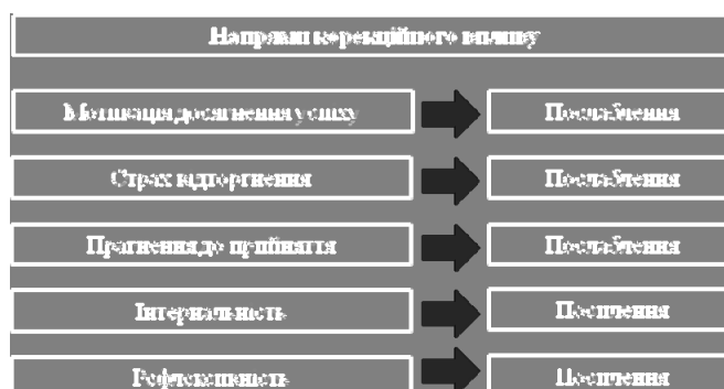
Рис. 1. Напрями корекції соціально-психологічних особливостей стилю споживання матеріальних благ особами з низьким економічним статусом

Слід зазначити, що не всі перераховані вище негативні прояви соціально-психологічних особливостей стилю споживання матеріальних благ властиві особам, що мають низький економічний статус, що певним чином ускладнює створення єдиної корекційної програми для носіїв низького економічного статусу. Крім того, ми вважаємо, що не всі негативні прояви соціально-психологічних особливостей стилю споживання матеріальних благ здатні піддатись корекції в рамках невеликої серії корекційних занять, адже для їхнього подолання потрібна більш глибока як тренінгова, так і психотерапевтична робота. До таких особливостей належать, зокрема, ціннісні компоненти, а також локус контролю, який є базовою психологічною настановою особистості щодо привласнення або відчуження відповідальності за власне життя. Тому ми сфокусувались на обґрунтуванні можливостей корекційного впливу, не прагнучі досягти корекції всіх означених негативних проявів соціально-психологічних особливостей стилю споживання матеріальних благ особами з низьким економічним статусом.