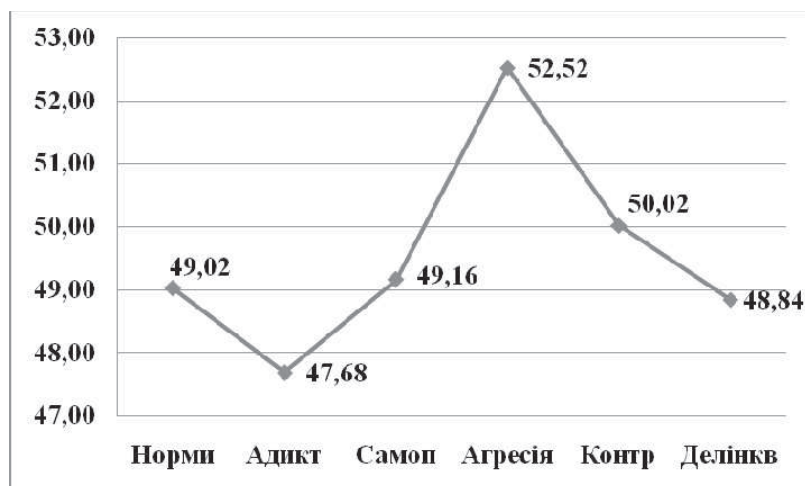
Рис. 2. Результати аналізу схильності підлітків до девіантної поведінки

При аналізі особливостей схильності підлітків до девіантної поведінки виявлено, що найбільш вираженою є схильність підлітків до агресії та насилля, тоді як найменш вираженою є схильність до адиктивної поведінки (рис. 2).