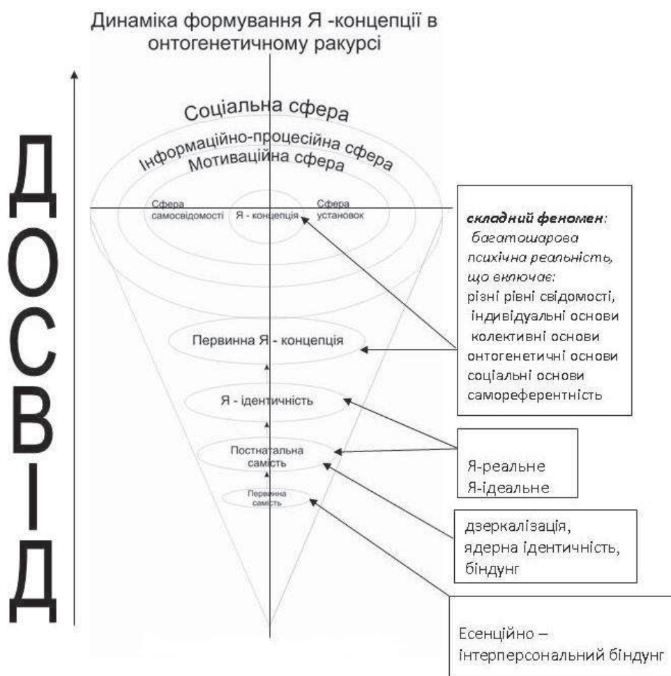
Рис. 1. Динамічна модель формування Я-концепції в онтогенетичному ракурсі

Обґрунтовано те, що якість ранньої прив'язаності між мамою та немовлям, задоволення базових дитячих его-потреб у дзеркалізації, ідеалізації (впевненості у всемогутності матері) та альтер-его (відчуття схожості з матір'ю), творить основу для формування первинного Я-образу та ядрової ідентичності та в подальшому Я-концепції (а їх порушення спричиняє порушення психічної інтеграції, що проявляється насамперед у нарцисичній психопатології) [9], [14], [15], [17].