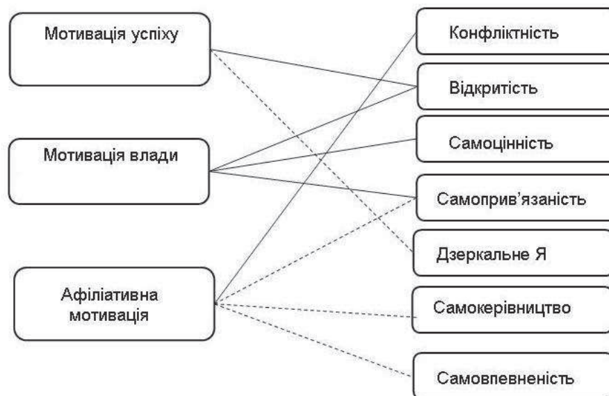
Рис. 2 Кореляційні зв'язки між показниками мотивів соціально-психологічної активності та самоствавлення особистості студентів

самосвідомості, як симпатія до самого себе, переконаність у тому, що його особистість викликає позитивні емоції в інших, прийняття себе таким, як є, небажання щось змінювати у собі, ригідністю Я-концепції, закритістю, нездатністю усвідомлювати проблеми, поверховим самовдоволенням, внутрішньою напруженістю щодо сприйняття негативних емоцій на свою адресу.