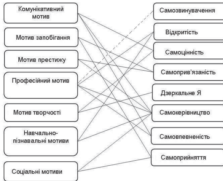
Рис. 3 Кореляційні зв'язки між показниками навчальної мотивації та самоствалення особистості студентів

Встановлено, що показники мотивації запобігання мають позитивні зв'язки з показниками самоствалення самоприв'язаності (0,12, p < 0,05 ), самоприйняття (0,15, p < 0,05 ). Ті студенти, які запобігають покарань у навчальній діяльності, приймають себе такими, які вони є, не самокритичні, ригідні.